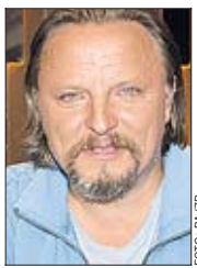
Schauspieler Axel Prahl

Prahl, der zurzeit für eine Rolle einen Bart tragen muss, gefällt das gar nicht: „Beim Essen bleibt immer etwas hängen, man muss den Bart ständig waschen. Und außerdem pikst er meine Frau beim Küssen.“ Über seine Erfahrung mit Drogen sagt der Schauspieler: „Ich hatte mal ein entsetzliches Erlebnis mit antönernen Pilzen. Ein Salat auf einer Party war damit versetzt. Ich war Anfang 20 und habe anschließend beim Besuch auf dem Rummel nur noch verzerrte Gesichter gesehen.“ jän