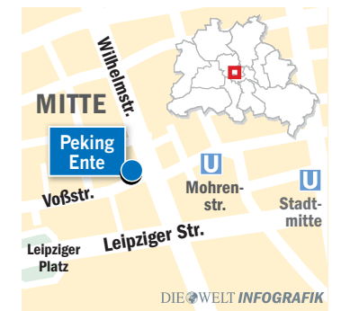
DIE WELT INFOGRAFIK

Öffnungszeiten Montag bis Freitag von 11.30 bis 23.30 Uhr. Von 11.30 bis 16 Uhr gibt es elf Mittagsgesamte inklusive Suppe für 5,80 bis 6,50 Euro. Sonnabend und Sonntag von 12 bis 23.30 Uhr geöffnet.