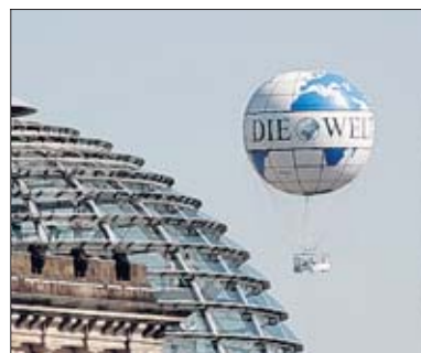
Der „Welt“-Ballon an der Zimmer-Ecke Wilhelmstraße in Mitte

Wer bislang noch nicht die Gelegenheit hatte, mit dem Hi-Flyer die Hauptstadt aus luftiger Höhe kennen zu lernen, für den gibt es jetzt ein besonders attraktives Angebot. An jedem Dienstag bis Ende Juli, dem sogenannten Berlin-Brandenburg-Tag, können von 10 bis 22 Uhr zwei Interessenten zum Preis eines einfachen Tickets für 19 Euro mit dem Ballon in die Luft steigen. Schneiden Sie den Coupon aus und steigen Sie etwa gemeinsam mit einem Familienmitglied, Freund oder Bekannten an einem Dienstag in die Gondel für das luftige Abenteuer über den Dächern Berlins! Bei guter Sicht sind nicht nur Sehenswürdigkeiten wie der Potsdamer Platz, das Regierungsviertel, der Hauptbahnhof, der Alexanderplatz mit Fernsehturm, das Brandenburger Tor oder der Tiergarten mit Siegesallee zu erblicken. Selbst in einer Entfernung von 80 Kilometern können Sie Objekte am Horizont erspähen. Die reguläre Fahrt mit dem