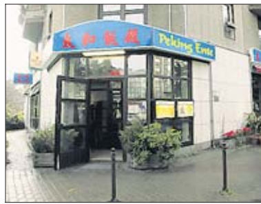
Das äußerlich unscheinbare Restaurant an der Voßstraße gibt es seit 1999

zierliche Asiatin über das derzeit starke Interesse an ihrem Restaurant. „Abends ist es jetzt noch voller“, sagt die 1994 nach Deutschland gekommene Chinesin in perfektem Deutsch. Doch sie setzt auf langfristigen Erfolg, für den ihre Eltern mit dem 1999 eröffneten Restaurant die Grundlage geschaffen haben. Jetzt soll die „Peking Ente“ noch etwas flotter werden, mit neuem Geschirr und gemütlicheren Tischen. Nur bei der Küche