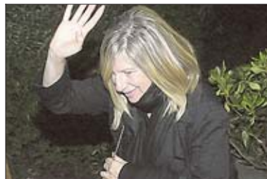
Sängerin Barbra Streisand nach ihrem Besuch in der „Peking Ente“